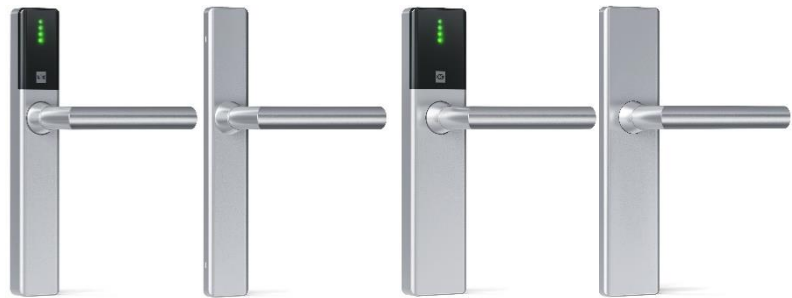
Guard Slimline Breite: 40 mm