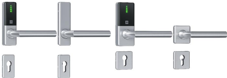
Guard Compact Slimline Breite: 40 mm