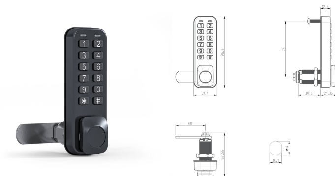
Corps long - Clavier vertical