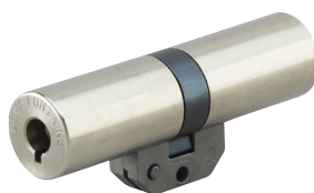
Cylindre Fontaine p. 35