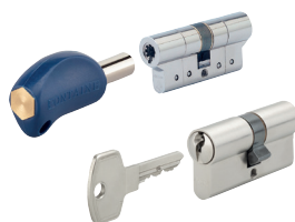
Cylindres européens p. 30 - 33