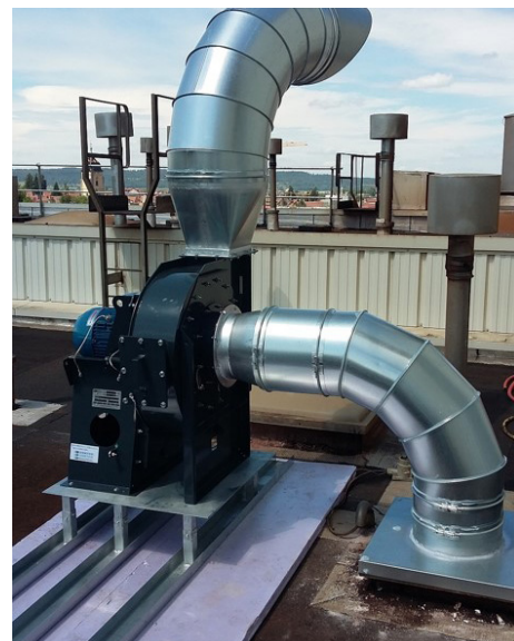
Extractie van verontreinigende stoffen met een NEU FEVI Easy Air ventilator