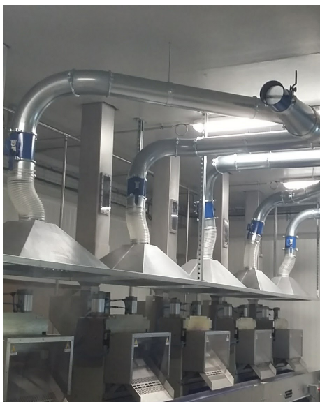
Extractie van oliedampen op rijstwafelpersen

Industriële ventilatie ter bestrijding van de verontreinigingen in werkplaatsen en arbeidsruimten.