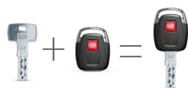
Twee systemen, één sleutel.

mechanische sleutels - kun je onze veelzijdige digitale ervaring uitbreiden naar al jouw sloten. Verenig jouw mechanische en digitale systemen met ENiQ en ontgrendel eindeloze mogelijkheden - jouw Digital Security Ecosysteem van DOM.